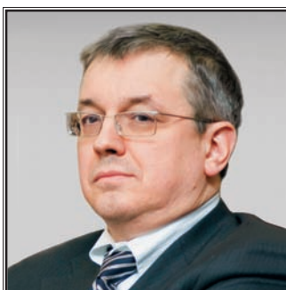
РЕКТОР ГОСУДАРСТВЕННОГО УНИВЕРСИТЕТА – ВЫСШЕЙ ШКОЛЫ ЭКОНОМИКИ Ярослав Иванович Кузьминов