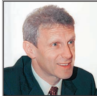
МИНИСТР ОБРАЗОВАНИЯ И НАУКИ РОССИЙСКОЙ ФЕДЕРАЦИИ Андрей Александрович Фурсенко