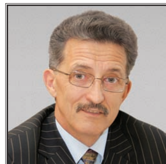
МИНИСТР ОБРАЗОВАНИЯ И НАУКИ РЕСПУБЛИКИ ТАТАРСТАН Наиль Мансурович Валеев