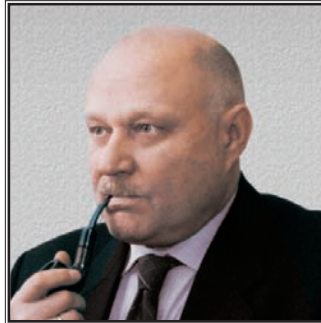
ДИРЕКТОР ДЕПАРТАМЕНТА КАДРОВ И СОПРОВОЖДЕНИЯ СПЕЦИАЛЬНЫХ ПРОГРАММ МИНИСТЕРСТВА ТРАНСПОРТА РОССИЙСКОЙ ФЕДЕРАЦИИ Борис Федотович Новосельцев