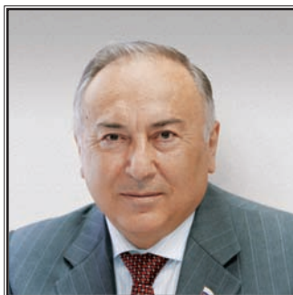
ПРЕДСЕДАТЕЛЬ КОМИТЕТА СОВЕТА ФЕДЕРАЦИИ ПО ОБРАЗОВАНИЮ И НАУКЕ Хусейн Джабраилович Чеченов