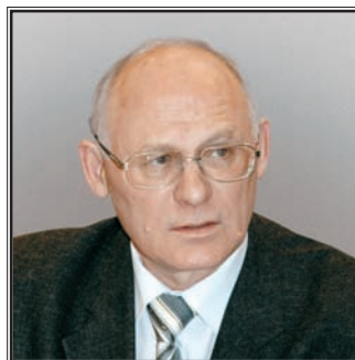
ПРЕДСЕДАТЕЛЬ КОМИТЕТА ГОСУДАРСТВЕННОЙ ДУМЫ ПО ОБРАЗОВАНИЮ Григорий Артемович Балыхин