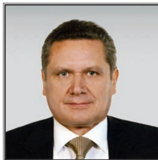
ДИРЕКТОР ДЕПАРТАМЕНТА МЕЖДУНАРОДНОГО СОТРУДНИЧЕСТВА МИНИСТЕРСТВА ОБРАЗОВАНИЯ И НАУКИ РОССИЙСКОЙ ФЕДЕРАЦИИ Владислав Власович Ничков