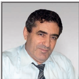
ЗАМЕСТИТЕЛЬ МИНИСТРА ОБРАЗОВАНИЯ И НАУКИ РОССИЙСКОЙ ФЕДЕРАЦИИ Исаак Иосифович Калина