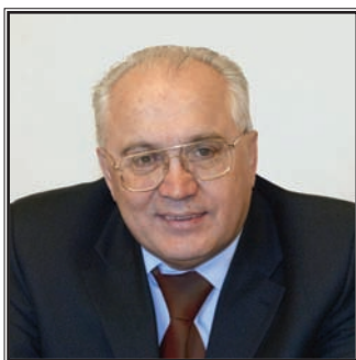
РЕКТОР МОСКОВСКОГО ГОСУДАРСТВЕННОГО УНИВЕРСИТЕТА, ВИЦЕ-ПРЕЗИДЕНТ РАН АКАДЕМИК Виктор Антонович Садовничий