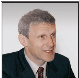
МИНИСТР ОБРАЗОВАНИЯ И НАУКИ РОССИЙСКОЙ ФЕДЕРАЦИИ Андрей Александрович Фурсенко