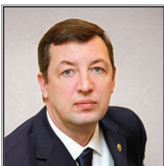
ПРЕДСЕДАТЕЛЬ КОМИТЕТА ПО ЗДРАВООХРАНЕНИЮ АДМИНИСТРАЦИИ Г. СУРГУТА Александр Рудольфович Пелвин