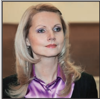
МИНИСТР ЗДРАВООХРАНЕНИЯ И СОЦИАЛЬНОГО РАЗВИТИЯ РОССИЙСКОЙ ФЕДЕРАЦИИ Татьяна Алексеевна Голикова