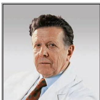
ГЕНЕРАЛЬНЫЙ ДИРЕКТОР ФГУ «РОССИЙСКИЙ КАРДИОЛОГИЧЕСКИЙ НАУЧНО-ПРОИЗВОДСТВЕННЫЙ КОМПЛЕКС РОСЗДРАВА», АКАДЕМИК РАН И РАМН Евгений Иванович Чазов