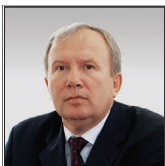
МИНИСТР ЗДРАВООХРАНЕНИЯ РЕСПУБЛИКИ БЕЛАРУСЬ Василий Иванович Жарко