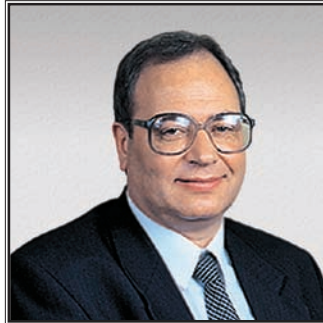
ЗАМЕСТИТЕЛЬ МИНИСТРА ЗДРАВООХРАНЕНИЯ И СОЦИАЛЬНОГО РАЗВИТИЯ РОССИЙСКОЙ ФЕДЕРАЦИИ Руслан Альбертович Хальфин