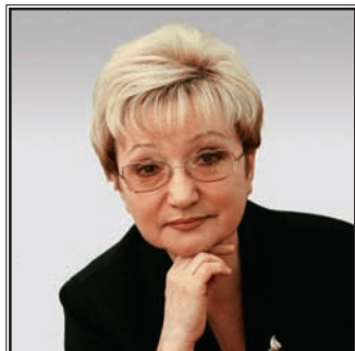
ПРЕДСЕДАТЕЛЬ КОМИТЕТА ГОСУДАРСТВЕННОЙ ДУМЫ ФЕДЕРАЛЬНОГО СОБРАНИЯ РОССИЙСКОЙ ФЕДЕРАЦИИ ПО ОХРАНЕ ЗДОРОВЬЯ Ольга Георгиевна Борзова