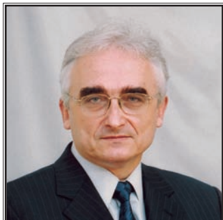
ПРЕДСЕДАТЕЛЬ КОМИТЕТА ПО ЗДРАВООХРАНЕНИЮ ПРАВИТЕЛЬСТВА САНКТ-ПЕТЕРБУРГА Юрий Александрович Щербук