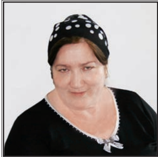
ЗАМЕСТИТЕЛЬ МИНИСТРА ЗДРАВООХРАНЕНИЯ ЧЕЧЕНСКОЙ РЕСПУБЛИКИ Зухра Саидовна Харкимова