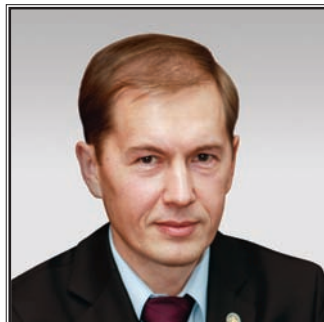
МИНИСТР ЗДРАВООХРАНЕНИЯ РЕСПУБЛИКИ ТАТАРСТАН Айрат Закиевич Фаррахов