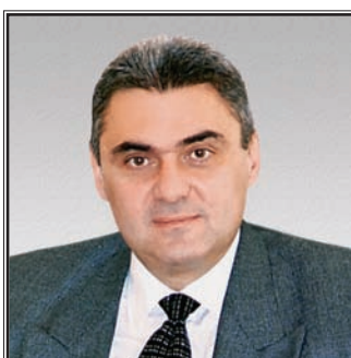
МИНИСТР ЗДРАВООХРАНЕНИЯ РЕСПУБЛИКИ АРМЕНИЯ, ДОКТОР МЕДИЦИНСКИХ НАУК Арутюн Кушкян