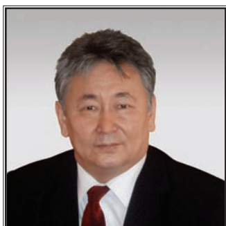
МИНИСТР ЗДРАВООХРАНЕНИЯ РЕСПУБЛИКИ ТЫВА Александр Доткан-оолович Ооржак