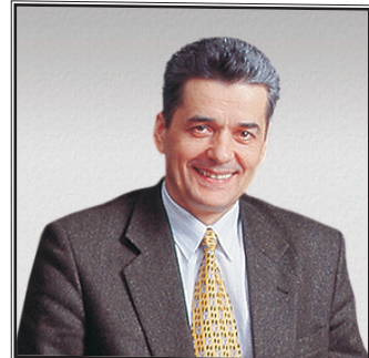
РУКОВОДИТЕЛЬ ФЕДЕРАЛЬНОЙ СЛУЖБЫ ПО НАДЗОРУ В СФЕРЕ ЗАЩИТЫ ПРАВ ПОТРЕБИТЕЛЕЙ И БЛАГОПОЛУЧИЯ ЧЕЛОВЕКА, ГЛАВНЫЙ ГОСУДАРСТВЕННЫЙ САНИТАРНЫЙ ВРАЧ РОССИЙСКОЙ ФЕДЕРАЦИИ, АКАДЕМИК РАМН Геннадий Григорьевич Онищенко